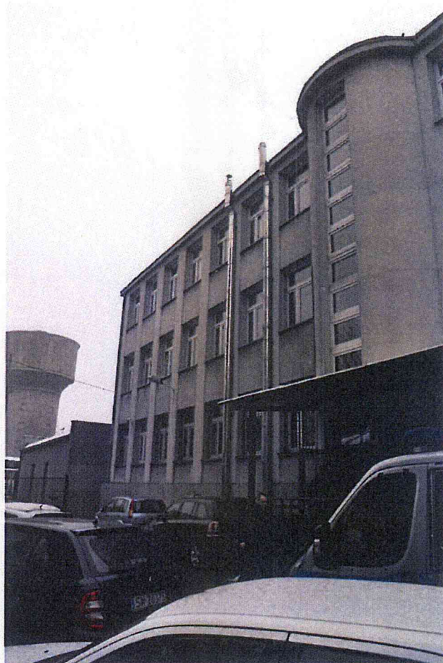
Fot. 1. Budynek I KP w Chorzowie przy ul. Batorego 19.