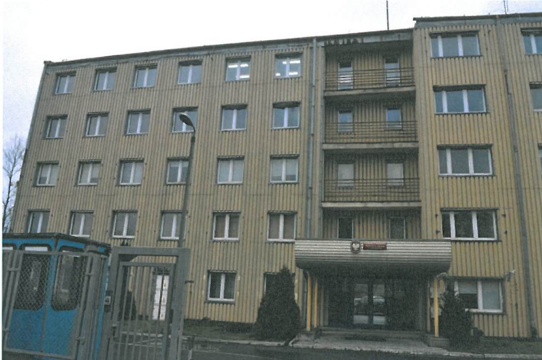
Fot. 1. Budynek Samodzielnego Pododdziału Prewencji Policji w Częstochowie widoczny zły części szczytowych ścian.