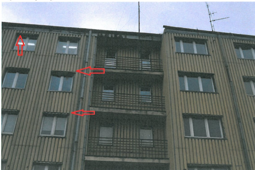
Fot. 2. Przykładowa lokalizacja nisz w pobliżu okien. Podobny stan odnotowano na większości okien budynku.