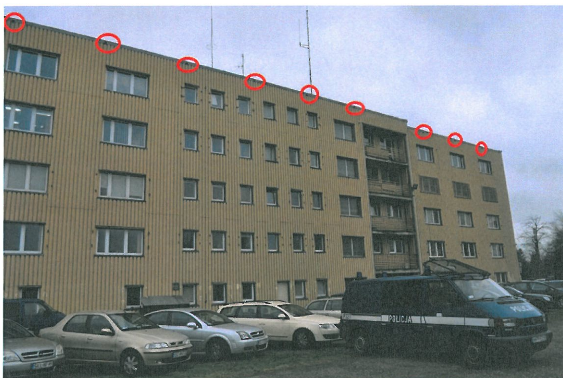
Fot. 3 i 4. Niezabezpieczone otwory wentylacyjne.