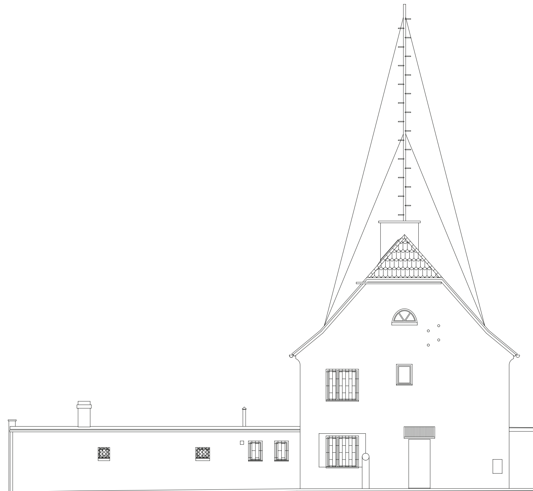
Elewacja Pn-zach skala 1:100